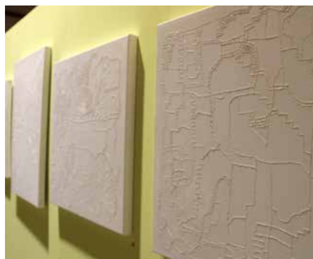
Gert Drenth borduurt met wit garen op wit doek.