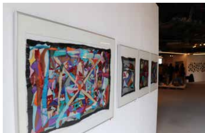
Shun-Yie Cheung maakt kleurrijke kunst van vilt.