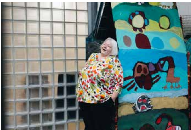
Jose de Haan schilderde op een heel lang doek.