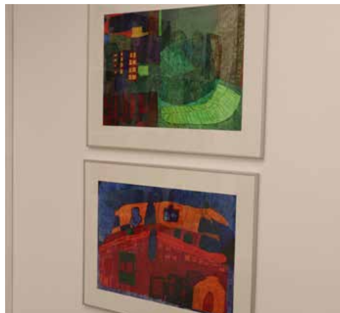
Hetty van de Riet maakt mooie kunst met kleurpotlood in de mooiste kleuren.