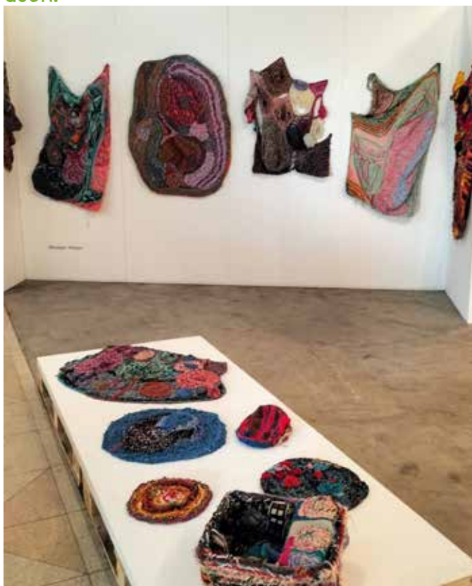
Monique Hinnen tovert met textiel.