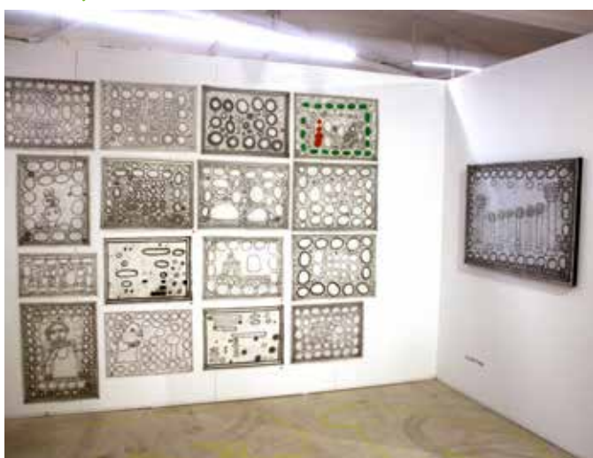
Arnold Fietje gebruikt grafiet potlood voor zijn kunst.